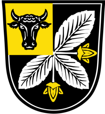
Buch am Buchrain